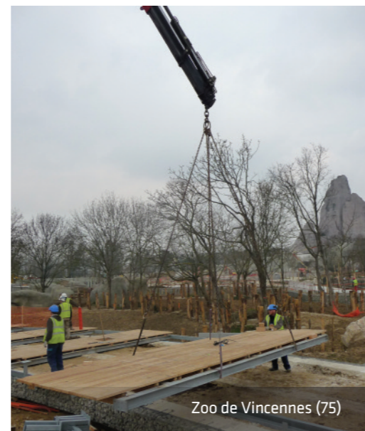
Zoo de Vincennes (75)

Ces platelages peuvent être équipés de garde-corps normalisés NFP 01-012 ou XP 98-405.