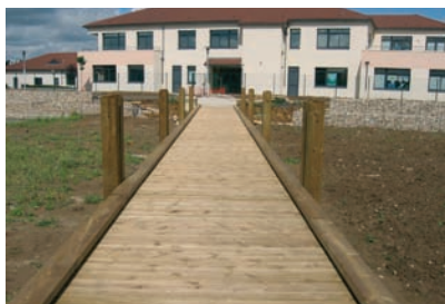
Passerelle avec chasse-roue