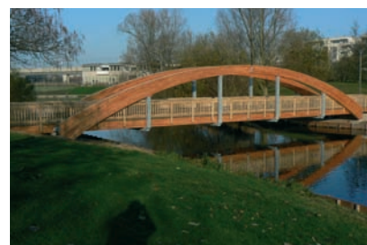
Passerelle lamellé-collé en mélèze - Arcs porteurs avec berceaux métalliques de suspension