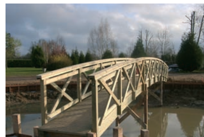
Passerelle cintrée sur portique Garde-corps en croix de St André (usage privatif)