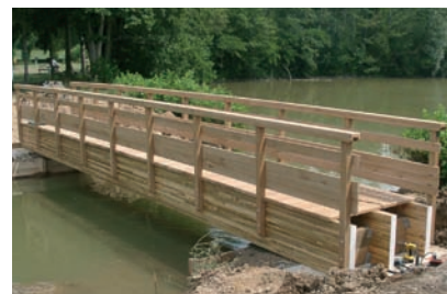
Passerelle droite lamellé-collé en pin Garde-corps en pin normalisé avec balustres verticales