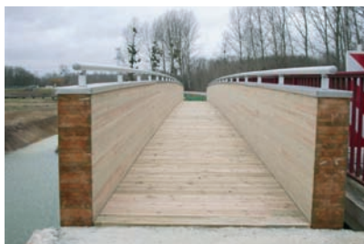
Passerelle grande portée - Structure et garde-corps en pin lamellé-collé Main courante en aluminium