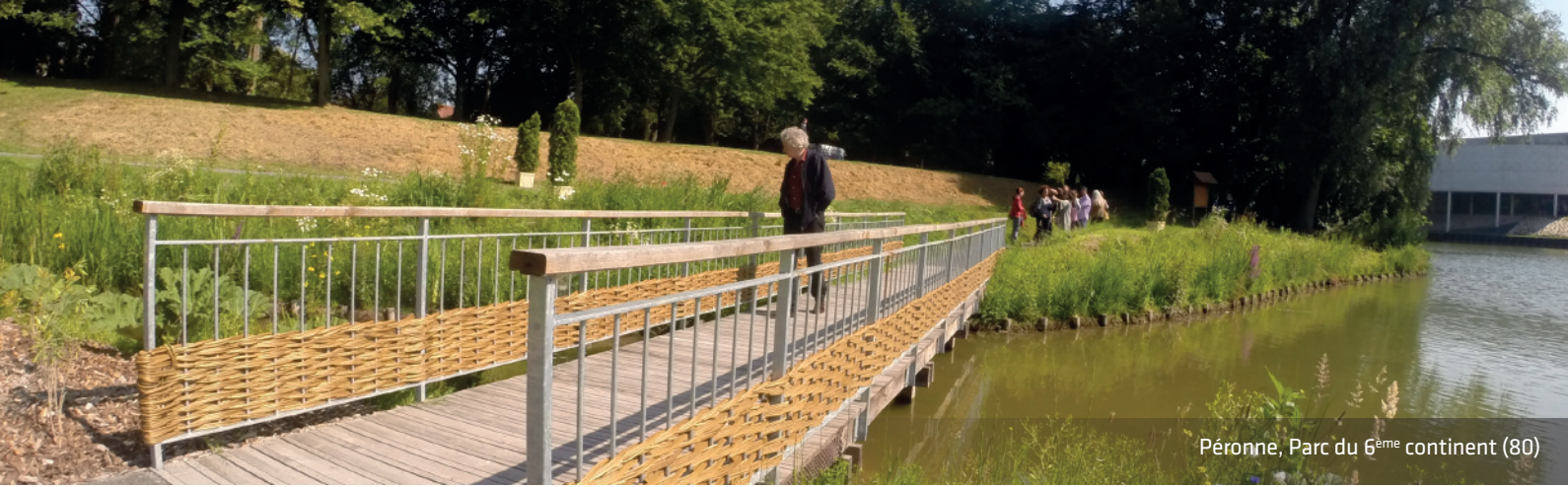
Péronne, Parc du 6 ème continent (80)