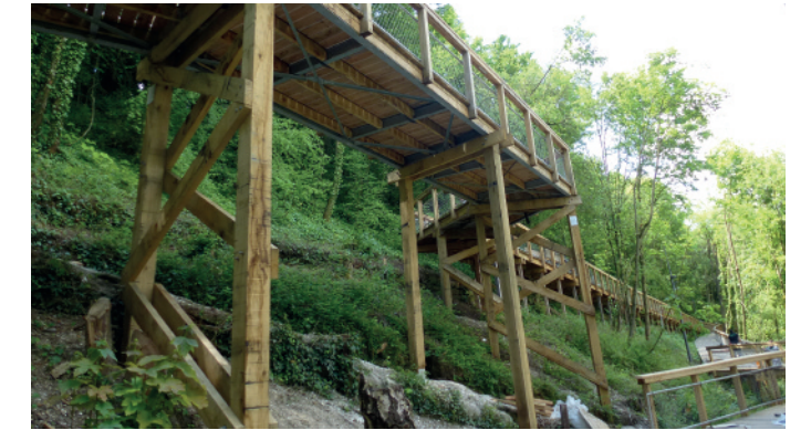
Beauvais, quartier du Coteau Saint-Jean (60)